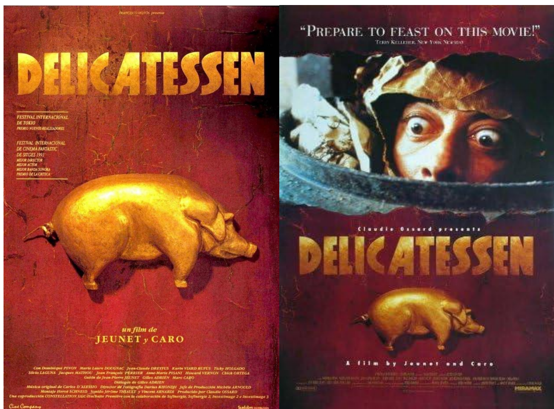
1. Affiche française