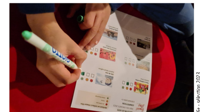
Bulletin de vote rempli par les enfants