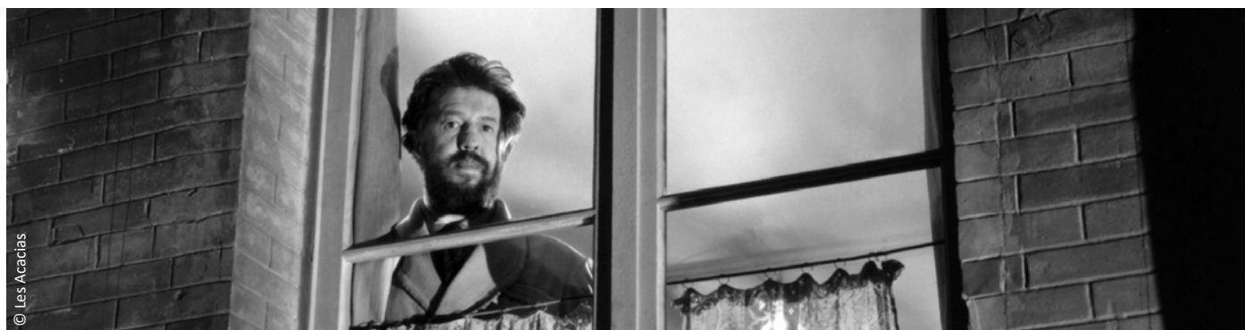
Panique de Julien Duvivier

Une rétrospective autour de 20 films mêlant classiques et curiosités de toutes les époques !