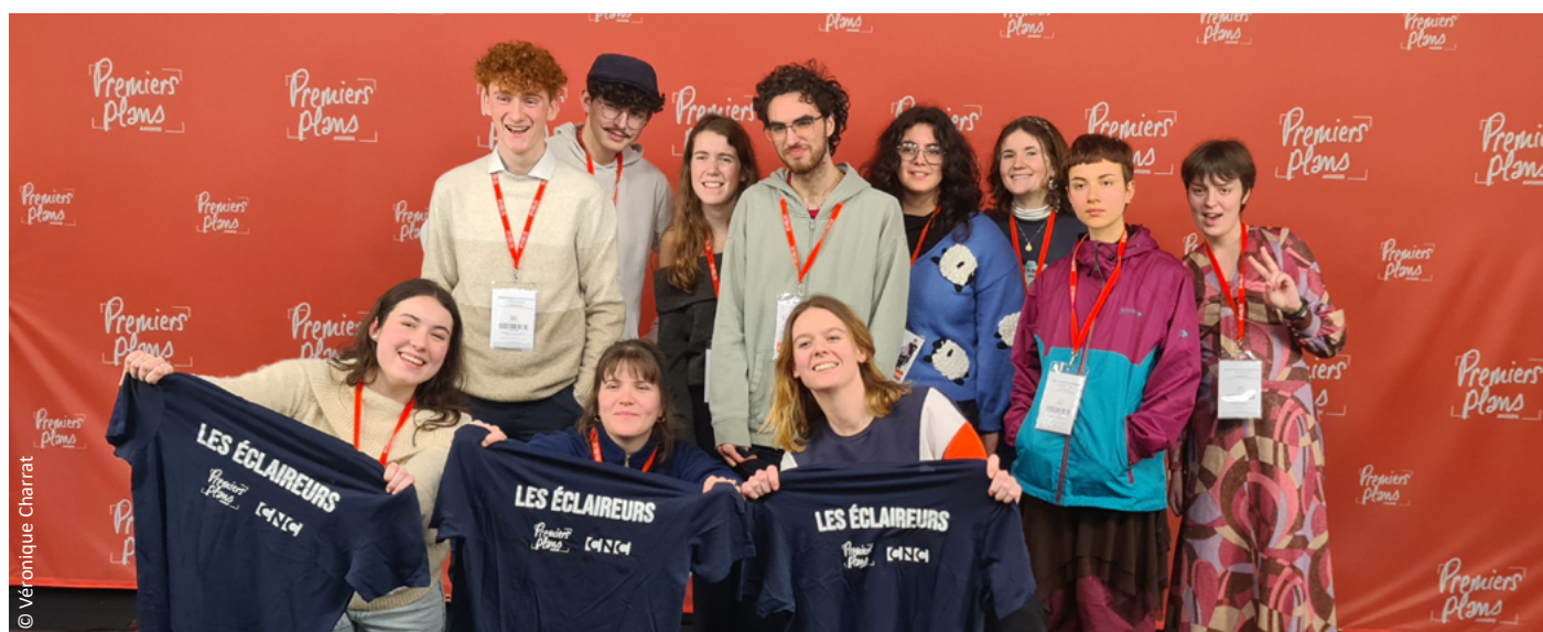
Les Éclaireurs 2024