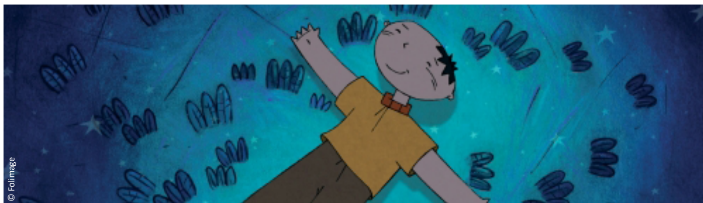
La Tête dans les étoiles de Sylvain Vincendeau