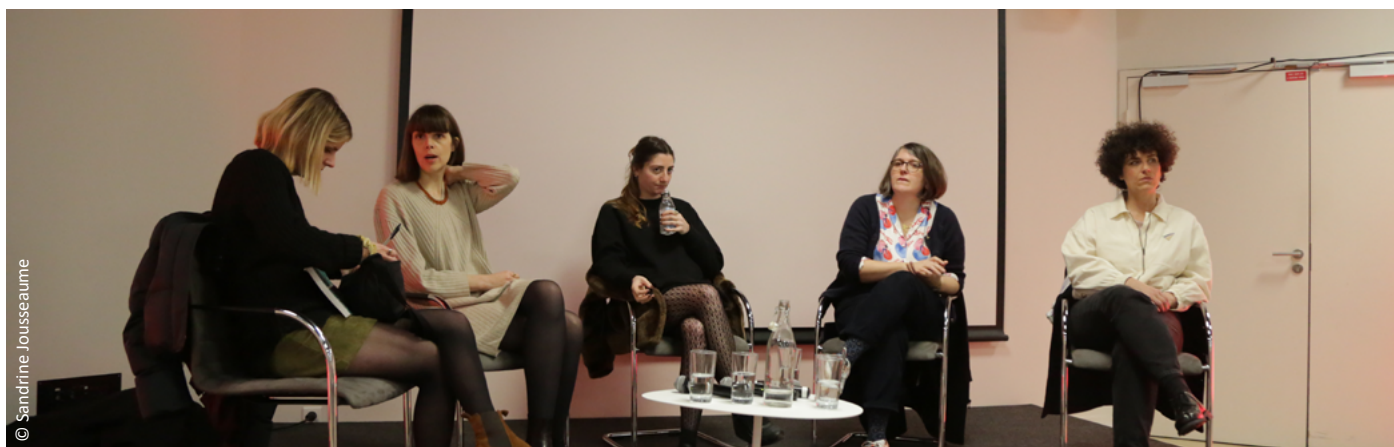
Table ronde Les Inspirantes au premier plan lors du Festival 2024