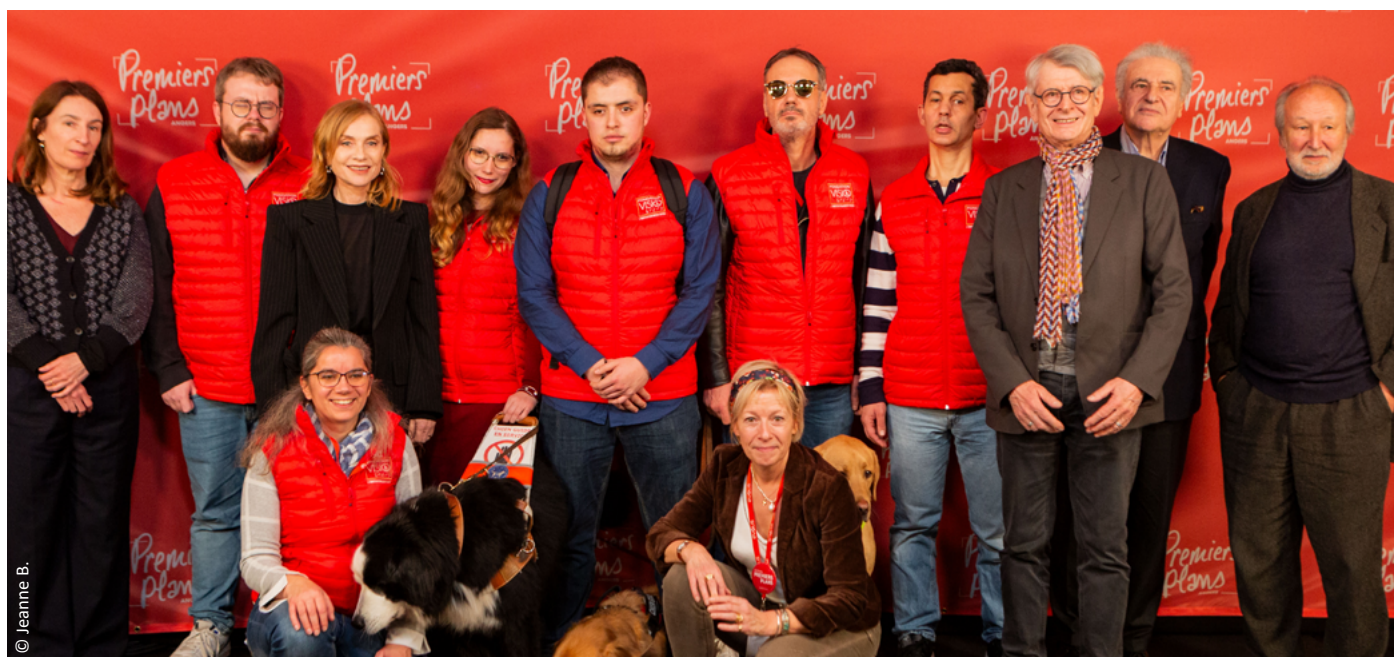
Le jury VISIO avec Isabelle Huppert

Le Festival rend son offre plus accessible aux personnes en situation de handicap et aux personnes âgées, en proposant :