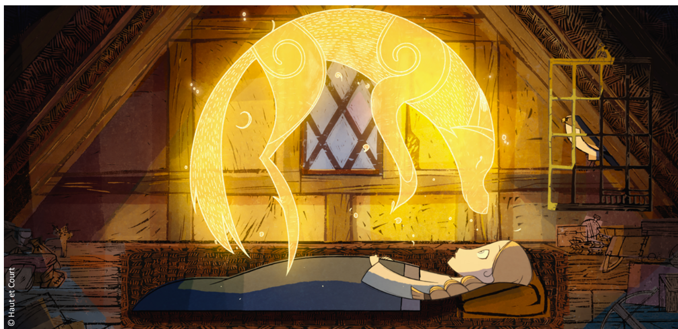
Le Peuple loup de Tomm Moore et Ross Stewart