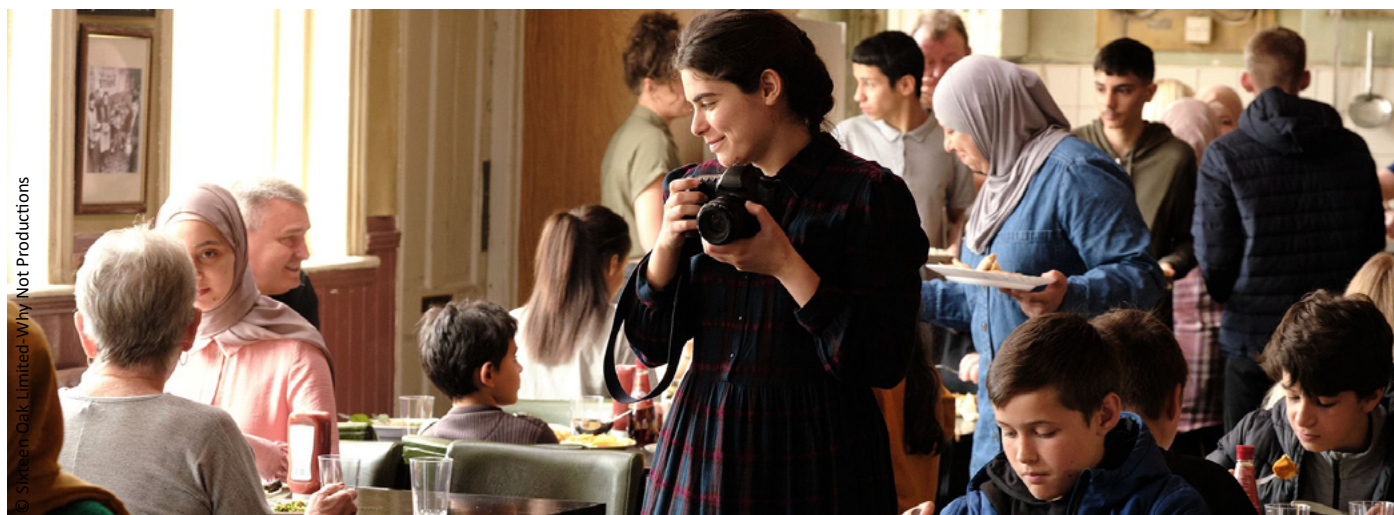
The Old Oak de Ken Loach