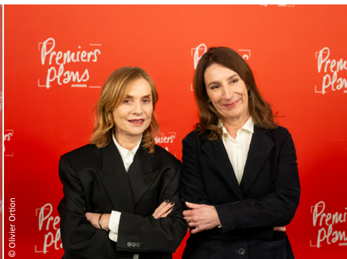
Isabelle Huppert et Élise Girard lors de la cérémonie de clôture