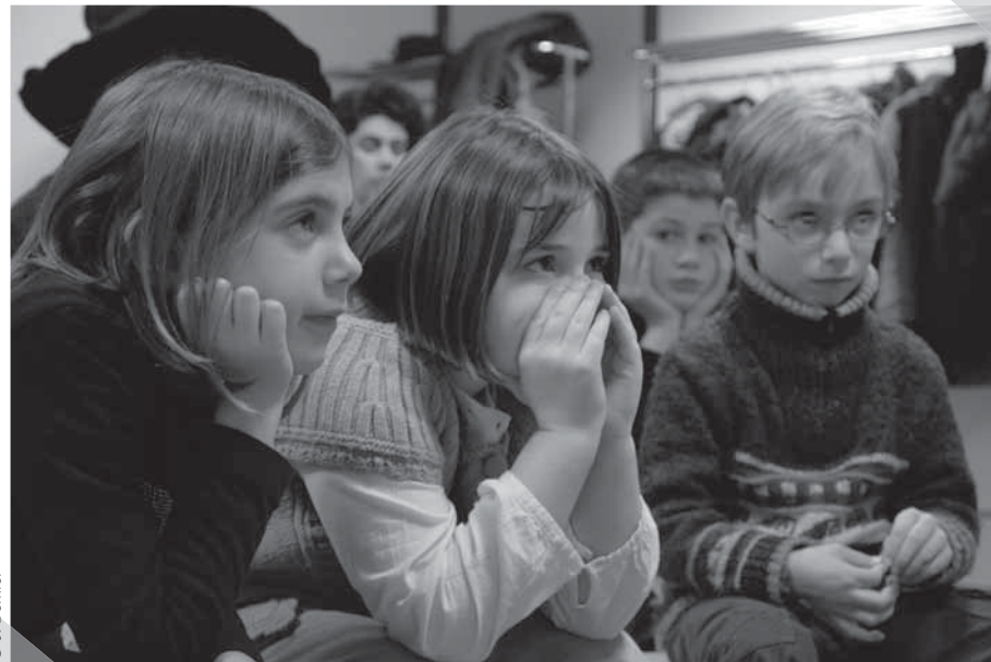
« Les bambins s'embobinent », des ateliers sur le thème de la peur destinés aux 6 - 10 ans