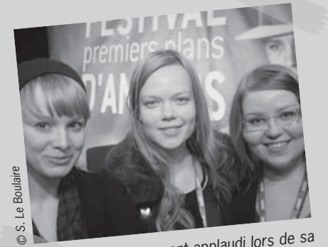
Benigni a été largement applaudi lors de sa projection

L'ouverture de la compétition dans la catégorie « films d'écoles » était l'occasion lundi de découvrir « Benigni », un court métrage des plus attachants, réalisé par un trio de Finlandaises.