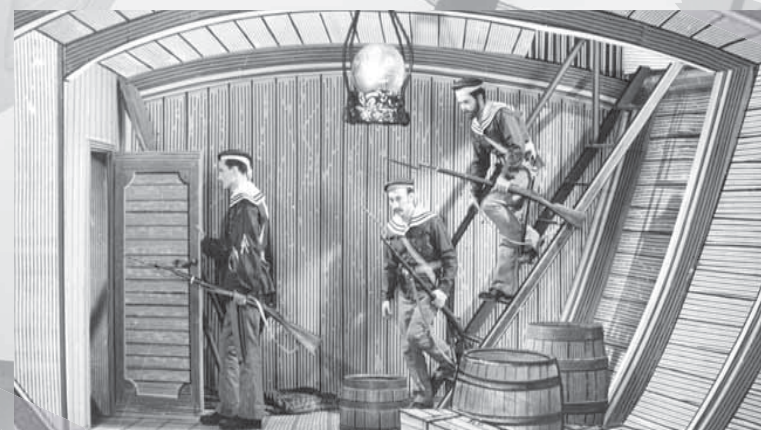
Incrustation d'acteurs tout droit sortis de l'univers animé de Jules Verne

L'éventail de ses compétences, déjà nombreuses et partout reconnues, ne s'arrête pas là. Fondateur d'une école de films animés en Tchécoslovaquie,