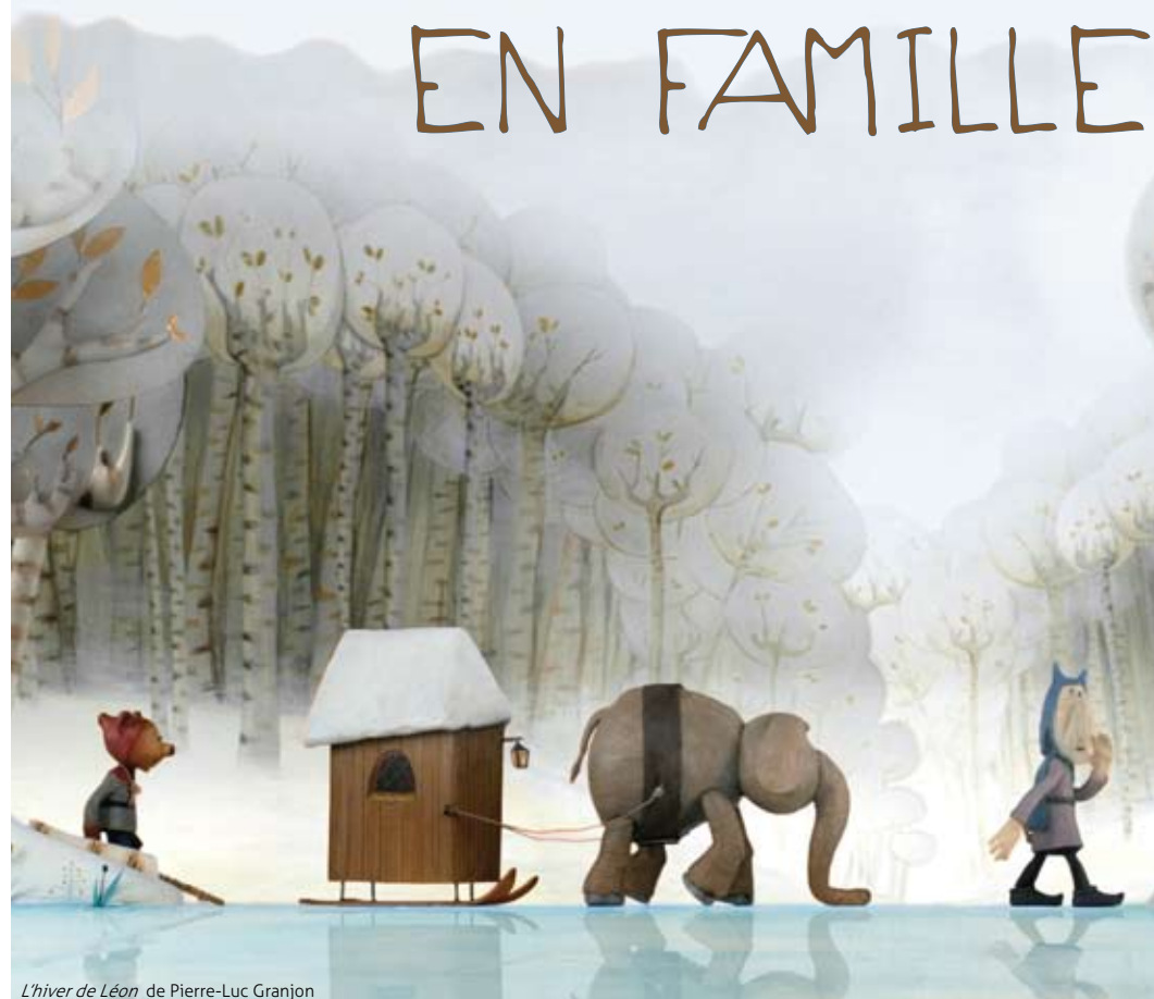
L'hiver de Léon de Pierre-Luc Granjon