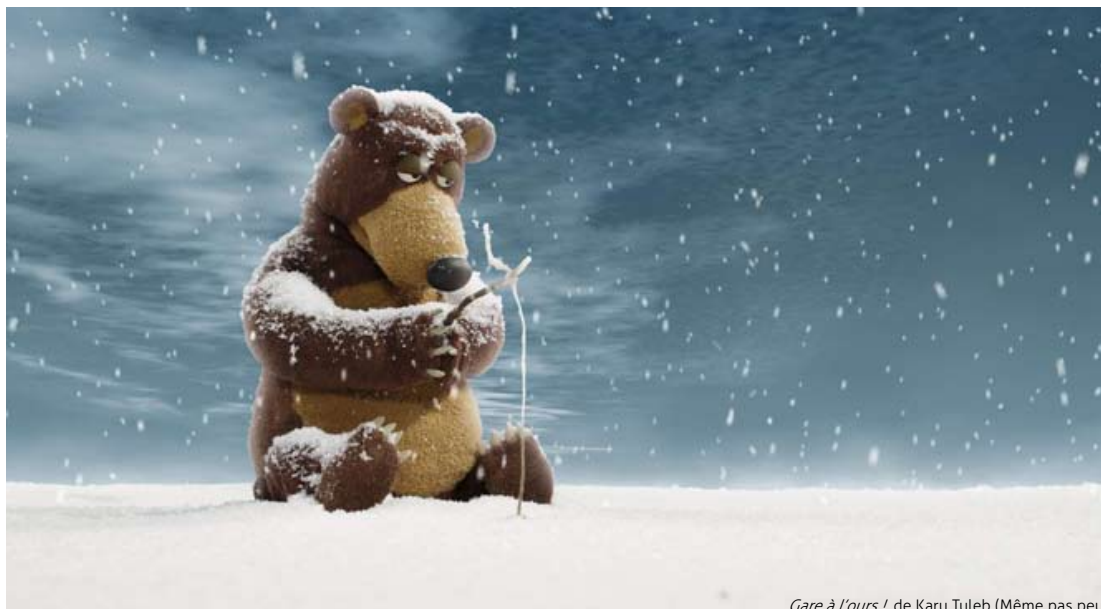
Gare à l'ours ! de Karu Tuleb (Même pas peur)

Samedis 23 et 30 janvier à 14h au Multiplexe